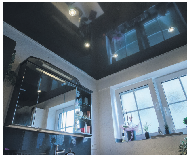
Ein echter Blickfang: Die edle, besonders pflegeleichte Lackspanndecke.

Eheleute Stenzhorn konnten bereits von Bekannten die realisierten Wohlfühloosen der erfahrenen Bäderprofis. Auch ein Grund für sie, sich für Maslinski zu entscheiden. Zum anderen war ihnen wichtig, dass alles aus einer Hand geboten wird. „Wir waren in der Zeit des Umbaus für zwei Wochen im Urlaub. Wir sind ganz beruhigt gefahren, denn es war alles bis ins kleinste Detail abgesprochen